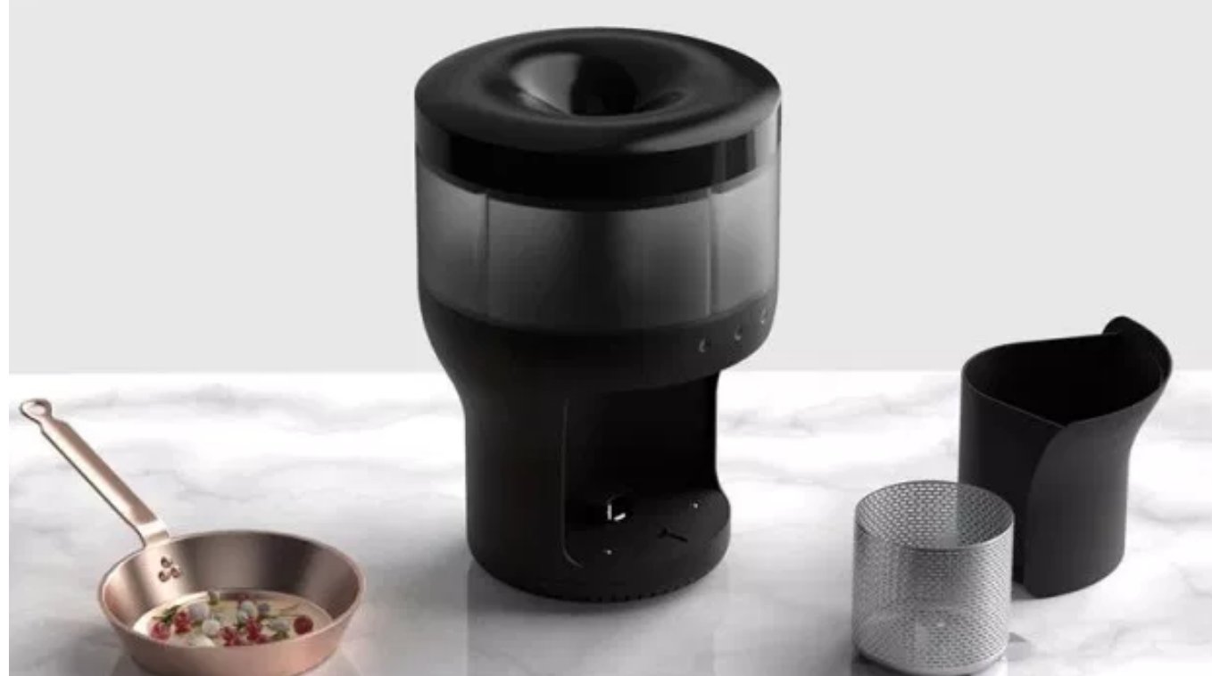
Braun Lambrate Design District 2019

Habits design studio, il capannone industriale di via Oslavia 17, ospita una mostra interattiva sulla storia di Braun, una mostra che invita a riflettere sui nuovi stili di vita domestica con progetti realizzati negli ultimi 3 anni nel laboratorio Smart Design-Scuola del Design Politecnico di Milano. Tra i temi affrontati spicca Zero Waste, l'area dedicata alla riduzione degli sprechi alimentari che mostrerà come riutilizzare gli avanzi di cibo.