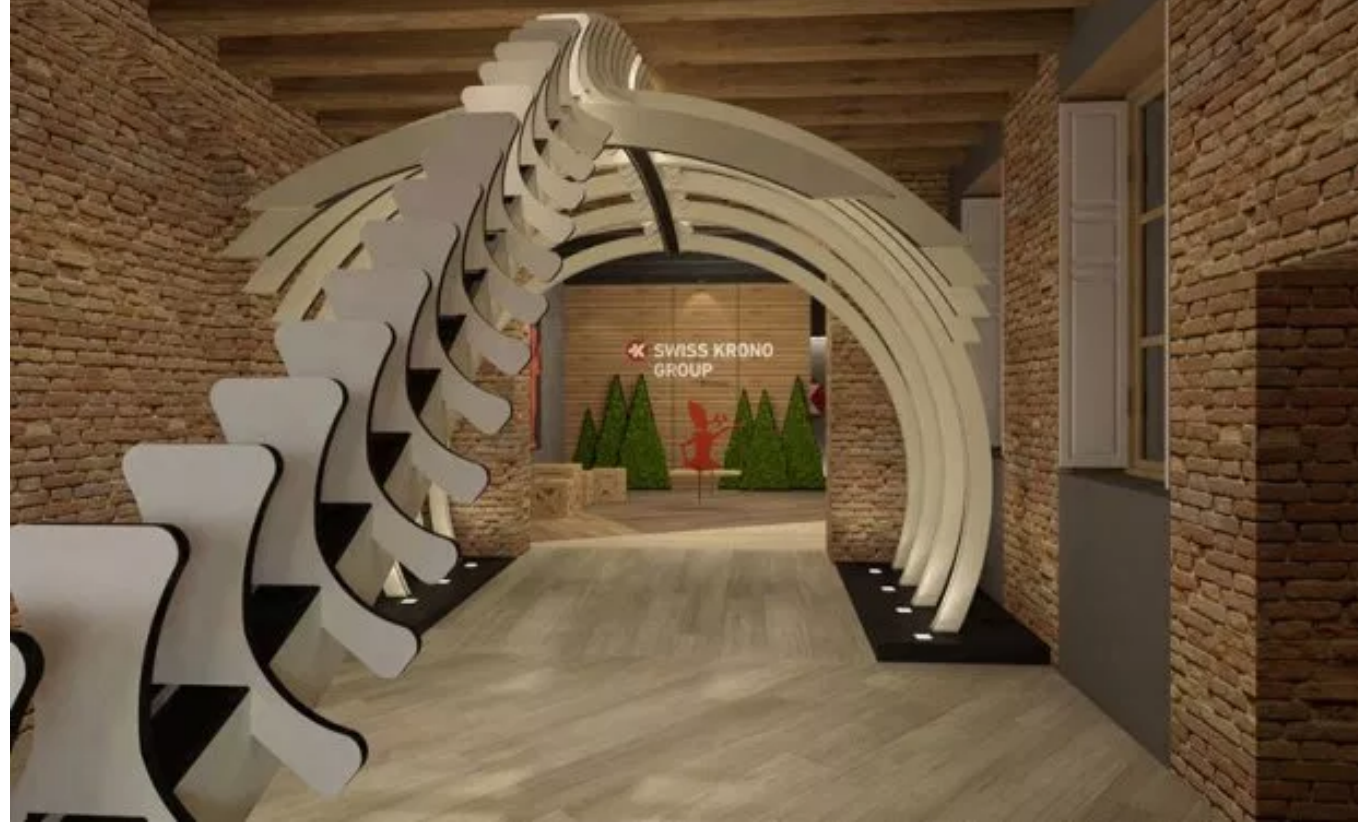
Swiss Krono Lambrate Design District 2019

Swiss Krono Group racconta il progetto BE SWISSTAINABLE, che vuole sensibilizzare sul tema della produzione etica ed ecosostenibile, ispirandosi alla fiaba di Pinocchio. Il progetto è un'"esposizione diffusa", che tocca tre luoghi del Fuorisalone: Brera, Piazza San Fedele e, appunto, Lambrate.