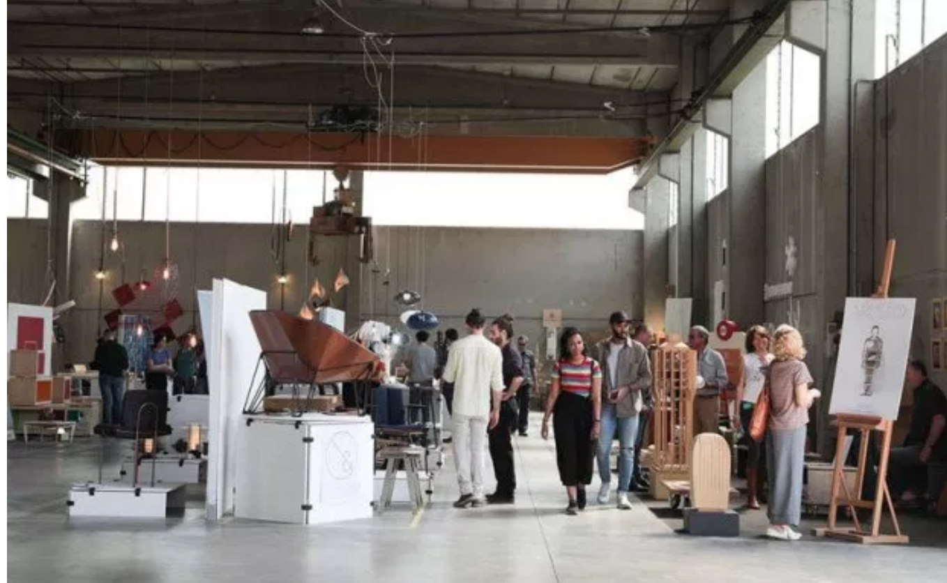
Din Design In Lambrate Design District 2019

Lambrate Design District torna al Fuorisalone anche nel 2019, con un ricco programma di eventi, mostre e installazioni, che occupano una superficie espositiva di oltre 13 mila metri quadrati e che, nel 2018, hanno attirato oltre 85 mila visitatori.