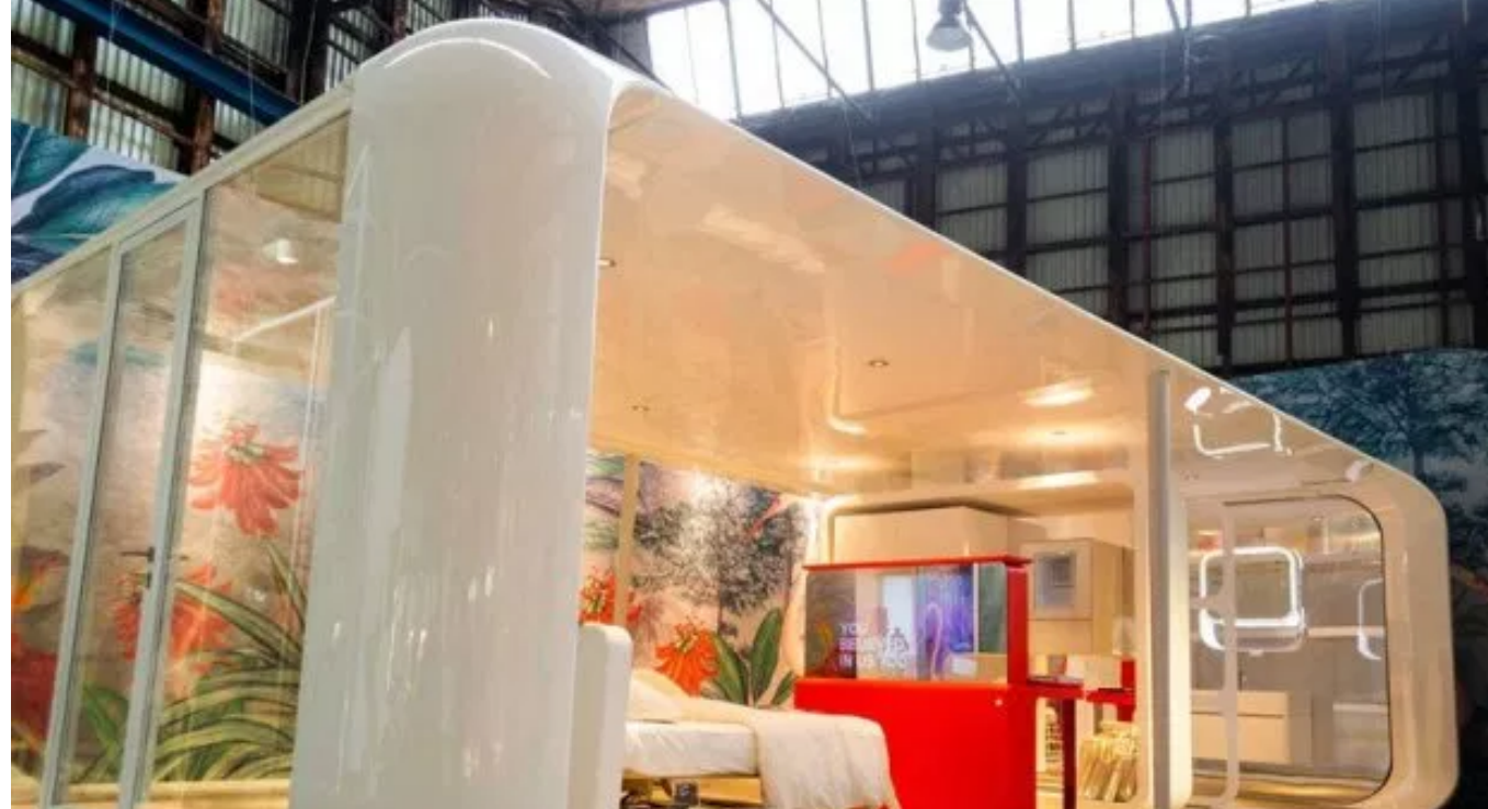
Lambrate Design District 2018