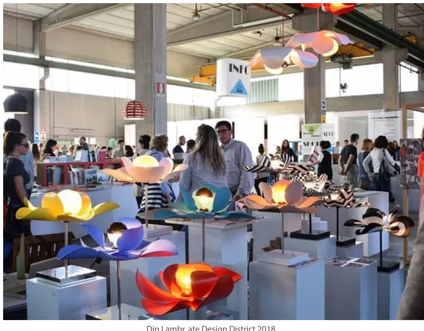
Din Lambrate Design District 2018

Per il settimo anno consecutivo, si svolge Din – Design In, mostra collettiva organizzata da Promotedesign.it che ospita di più di 100 designer, aziende e scuole di design, tra cui l'Università degli studi G. d'Annunzio di Chieti-Pescara.